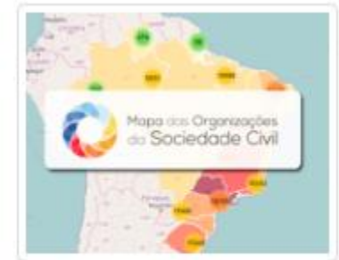
Mapa das OSCs